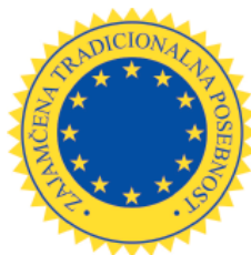
Evropski in nacionalni znak za zajamčeno tradicionalno posebnost

Zajema kmetijske pridelke in živila, ki med istovrstnimi prehranskimi pridelki in živila izstopajo zaradi boljše kakovosti (imajo npr. večji sadni delež, kot je predpisano, so proizvedena brez dovoljenih aditivov). Posebne lastnosti proizvoda, se določajo glede na sestavo, senzorične ali fizikalno-kemične lastnosti ter način pridelave oziroma predelave.